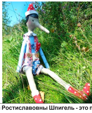
Работы Натальи Ростиславовны Шпигель - это полёт фантазии плюс отточенное мастерство, в основе которых - огромное желание создавать сказку!