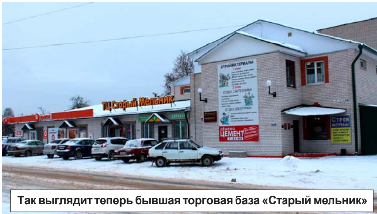
Так выглядит теперь бывшая торговая база «Старый мельник»