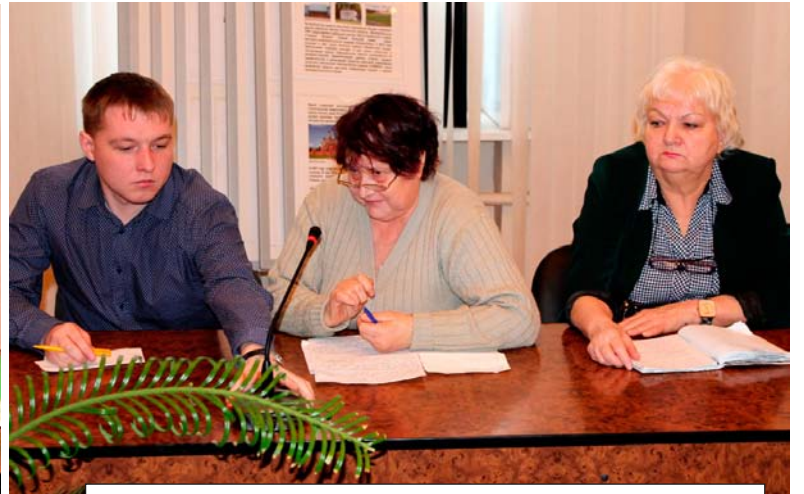
У старших домов вопросов, связанных с капитальным ремонтом, по-прежнему много, и они ждут пояснений от регионального оператора

капремонт, то сроки могут быть сдвинуты. Заявку на первоочередников подает муниципальная власть. Кстати, в текущем году в Ярцево запланировано поставить на капитальный ремонт 13 многоквартирных жилых домов, а по области их 60.