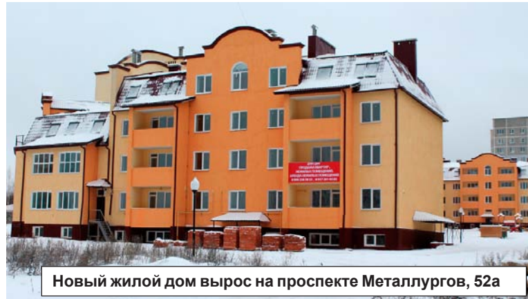
Новый жилой дом вырос на проспекте Металлургов, 52а

имущество, поэтому не спешат регистрировать свою недвижимость. Но, на мой взгляд, выгода получается мнимой. Если человек не сдал дом в эксплуатацию, то он платит налог за аренду земельного участка, но если строение оформлено по всем правилам, то его владелец может перевести землю в собственность. Вот здесь и наступает выгода. Ведь арендатор платит налог за земельный участок в 3 раза больше, чем собственник земли. Об этом стоит подумать.