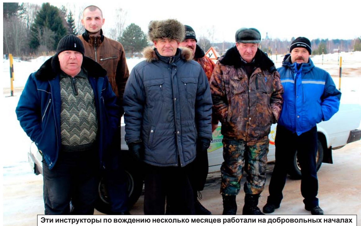
Эти инструкторы по вождению несколько месяцев работали на добровольных началах

ся огромные для этого заведения финансовые потери.