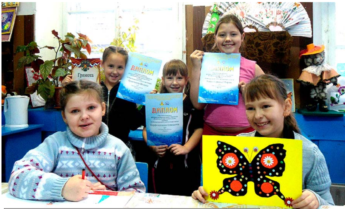
Дети получают радость как от самого творчества, так и от наград за него

В помещении, где расположен кружок, много различных поделок. Они заполняют все полки, расположенные вдоль стен. Здесь и куклы, и картонные домики для них, и картины, выполненные в различных техниках, и композиции из сухоцветов, и зверушки из подручных материалов. Но это лишь часть того, что создается на территории творческого объединения. Почти все свои работы дети уносят домой, и им это доставляет неопишемую радость. Когда мама на 8 Марта получает в подарок единственную в своем