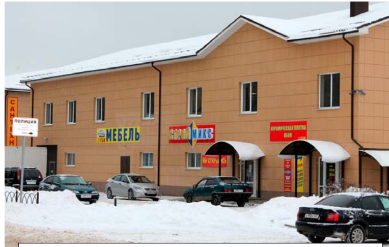
Новый объект торговли появился на улице Энтузиастов, 34