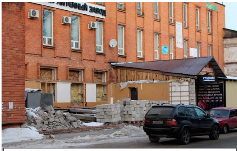
На улице Ленинской сносят незаконно возведенную пристройку

этим видом деятельности, обязаны соблюдать градостроительные нормы. Застройщик планировал вместо снесенных деревянных бараков, которые располагались возле перекрестка улиц Горького и Гагарина, построить жилой дом с офисными помещениями на первом этаже. Именно